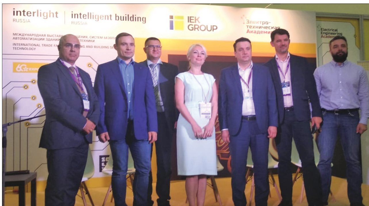
Рис. 1. Подписание Соглашения о сотрудничестве на выставке Interlight Russia | Intelligent Building Russia

«Мы видим в таком инструменте, как Национальная система цифровой маркировки, только плюсы: помощь